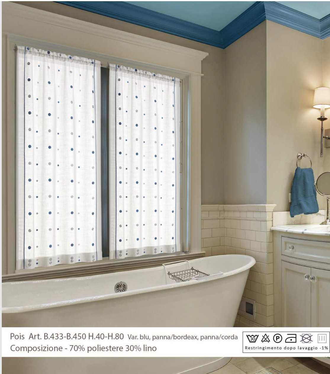
Pois Art. B.433-B.450 H.40-H.80 Var. blu, panna/bordeaux, panna/corda Composizione - 70% poliestere 30% lino