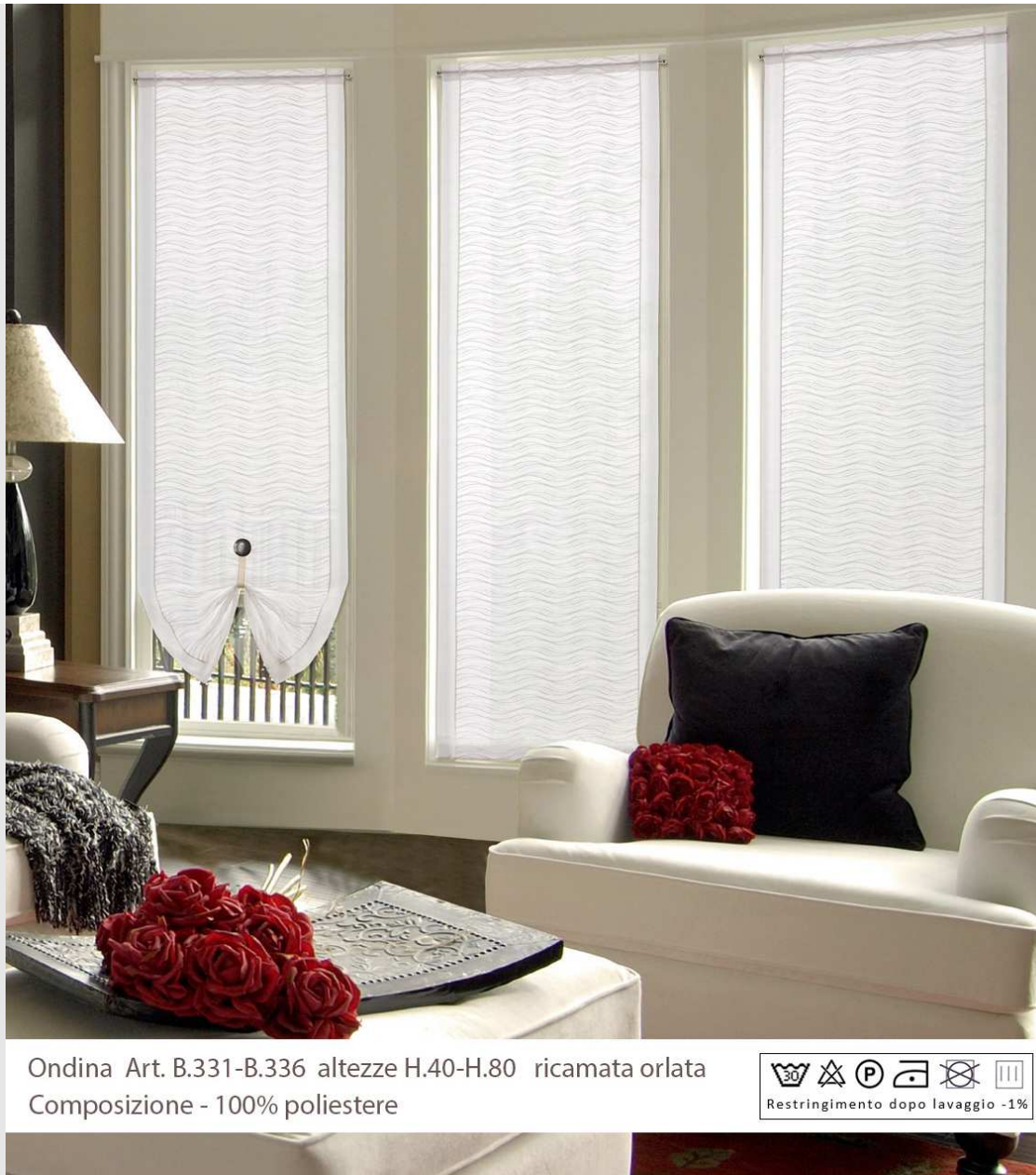
Ondina Art. B.331-B.336 altezze H.40-H.80 ricamata orlata Composizione - 100% poliestere