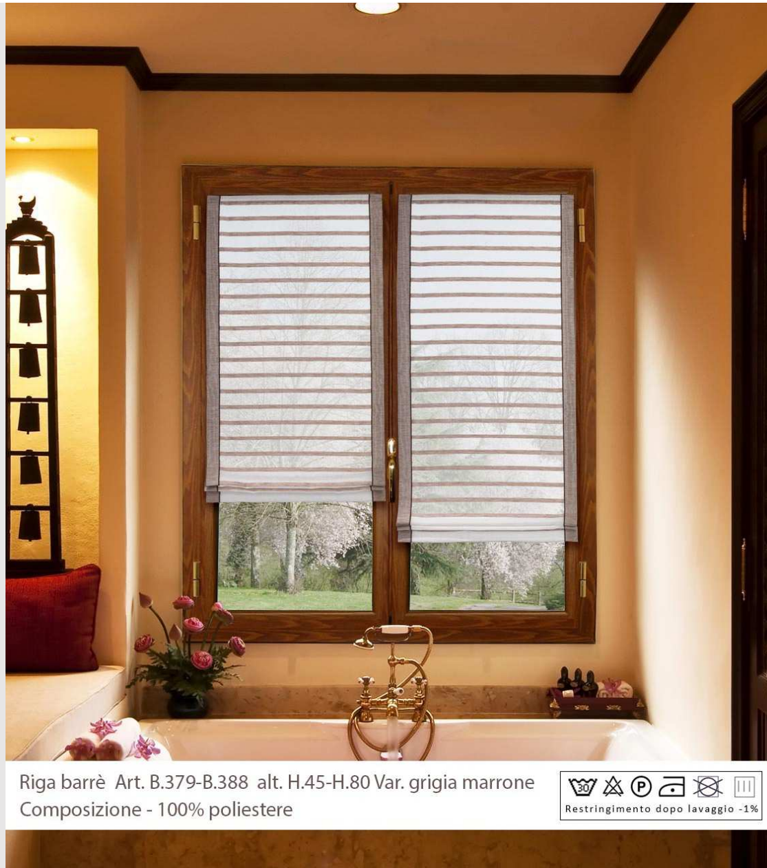
Riga barrè Art. B.379-B.388 alt. H.45-H.80 Var. grigia marrone Composizione - 100% poliestere