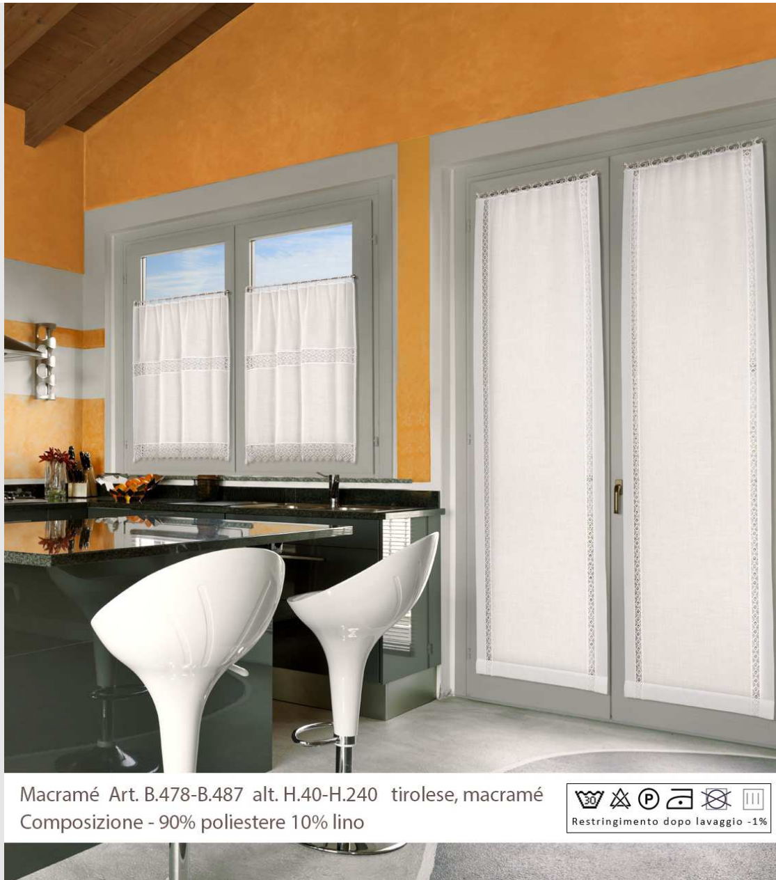
Macramé Art. B.478-B.487 alt. H.40-H.240 tirolese, macramé Composizione - 90% poliestere 10% lino